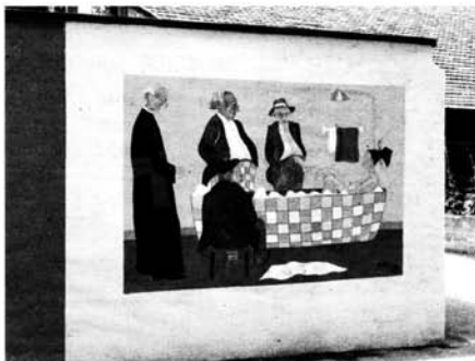
'Clotilde nel bagno di schiuma' di Dietrich Bickler

POGNO - Pogno è un "paese dipinto". Dopo Legro di Orta coi suoi quadri ispirati al cinema, un altro centro del Cusio è stato abbellito con dei murales - in tutto 7 in diverse abitazioni del centro storico - incentrati sull'acqua, elemento indispensabile per l'industria locale fondata sulla rubinetteria e che, inequivocabilmente, richiama il lago d'Orta. L'inaugurazione delle opere d'arte, realizzate da artisti di fama internazionale, è avvenuta lo scorso 26 giugno in occasione della festa patronale, alla presenza di numerose autorità civili e politiche della zona e della banda musicale di Gozzano. Per l'occasione hanno fatto bella mostra di sé anche gli stand coi prodotti biologici della riviera occidentale del lago e la fontana di cioccolato realizzata dalla ditta "Chocolate Stella" di Giubiasco.