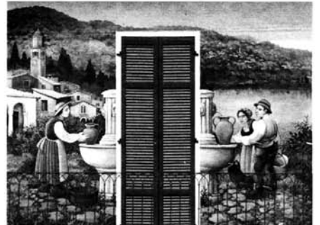
Partendo dall'alto il dipinto di Mora e quello di Caramagno

l'opera. La realizzazione dei murales si inserisce nell'ottica più ampia del progetto di promozione turistica dell'Unione dei comuni del Cusio "La strada dei sogni". Un progetto finanziato coi fondi europei Interreg IIIA Italia-Svizzera 2000-2006 che ha lo scopo di promuovere il territorio cercando di valorizzare le sue bellezze ambientali ma anche il bagaglio storico-culturale.